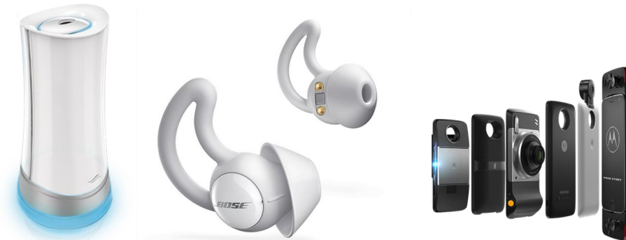
図表 5: Indiegogo Enterprise でキャンペーンが行われた製品 (左から、P&G 社 "Airia Electronic Scent Dispersal™", BOSE 社 "NOISE-MASKING SLEEPBUDS™", Motorola 社 "moto z3™")